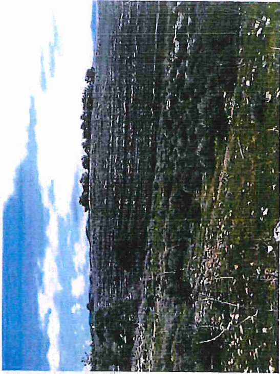
Το ύψος εκτίμηση ακίνητο.